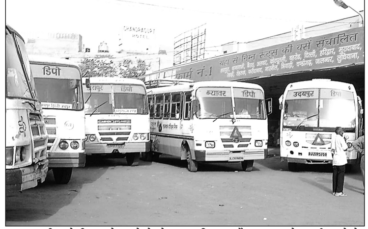
शुरू कर दी जायेगी। इससे पहले रोडवेज हरियाणा और गुजरात के कई शहरों के लिए बसों का संचालन कर रहा है।

जयपुर। करीब 5 महीने के बाद अनलॉक 4.0 में राजस्थान रोडवेज अब उत्तरप्रदेश और मध्यप्रदेश के साथ ही प्रसिद्ध धार्मिक स्थलों के लिए बसों का संचालन शुरू करने जा रहा है। 7 सितंबर से रोडवेज बसों का यूपी और एमपी के लिए संचालन शुरू होने जा रहा है। इसे लेकर सभी तैयारियां पूरी कर ली गई हैं। हालांकि, रोडवेज ने उत्तरप्रदेश के मथुरा और आगरा के लिए गुरुवार से ही बसों का संचालन शुरू कर दिया है, लेकिन सोमवार से अन्य शहरों के लिए भी बसें शुरू कर दी जाएंगी। 7 सितंबर से प्रसिद्ध धार्मिक स्थलों के लिये भी बसें