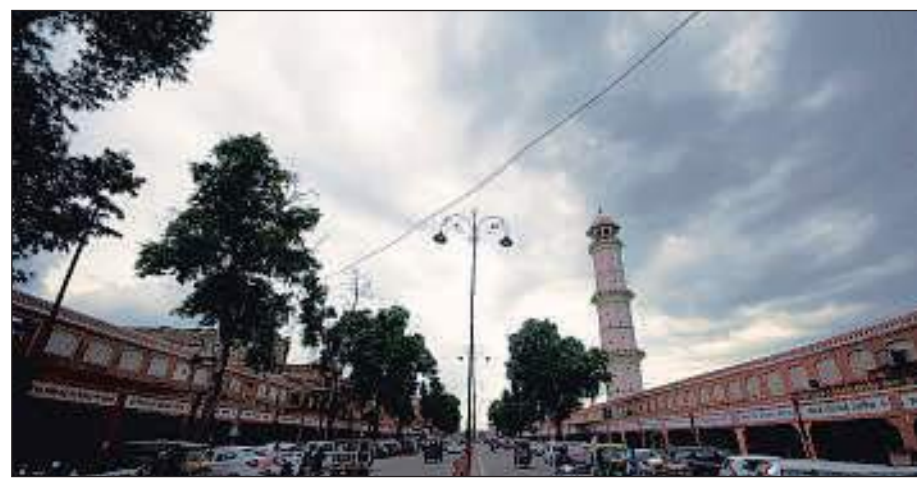
Dark clouds hover over Jaipur sky, on Thursday.

to his release from jail as "historic" and said he is hopeful that "no other innocent person"