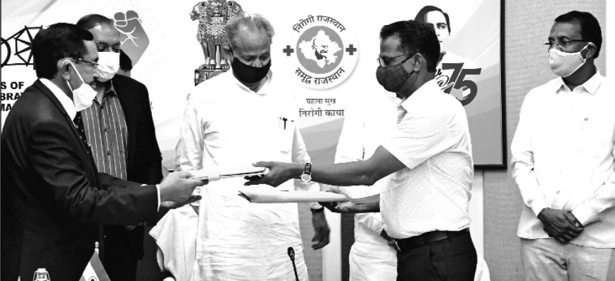
तहत कंपनी की ओर से राजस्थान में रक्षा एवं पर्यटन परियोजना, एयरक्राफ्ट मॉटेनेंस, रिपेयर एण्ड ओवरहॉल प्रोजेक्ट, एक उड्डयन अकादमी तथा टेक्सटाइल से संबंधित एक परियोजना विकसित करने का प्रस्ताव है। इस निवेश से प्रदेश में 4000 व्यक्ति यों के लिए रोजगार के अवसर पैदा होंगे।

मुख्यमंत्री की उपस्थिति में श्री वल्लभ पित्ती ग्रुप के साथ एमओयू हस्ताक्षरित