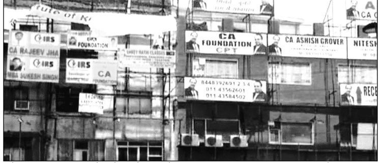
कोचिंग छात्र इसी सपने को संजोकर कोटा अर्थव्यवस्था का मूल आधार भी कोचिंग इंडस्ट्री पहुंचते हैं तो कोटा कोचिंग से लेकर शहर की

कोटा। कोचिंगसिटी कोटा में कोरोना ने हॉस्टल इंडस्ट्री की कमर तोड़ दी है। कोरोनाकाल में शहर के कोचिंग संस्थान लॉकडाउन में बंद हुए। इन पर ताले पड़ गए। इधर अब बैंक की इएमआई भी एक सितंबर से शुरू हो गई। जिससे लाखों रुपये की किश्त हर महीने हजारों हॉस्टल संचालकों को बैंकों को देनी होगी। वहीं कमाई ज़ीरो है। ऐसे में कोटा की हॉस्टल इंडस्ट्री और हॉस्टल संचालक मुसीबत में आ गए हैं।