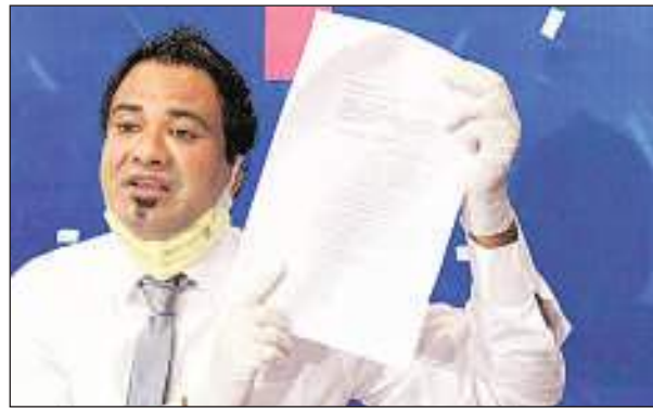
Kafeel Khan addresses a press conference, in Jaipur on Thursday.

"I will be soon writing a letter requesting him that my job be given back to me. Since the last three years, I have been suspended. I want to contribute in the battle against Coronavirus since I have 10 years of experience in handling cases in intensive care units," Khan told the