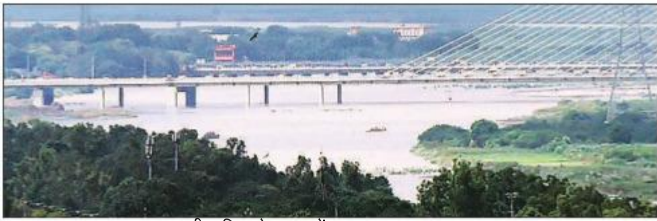
भारी बारिश से यमुना में लगातार बढ़ता जलस्तर।